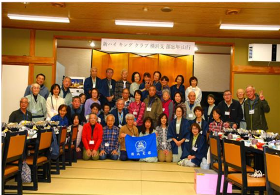
「忘年山行宿泊者による集合写真」(2024.12.14 宏池荘にて)