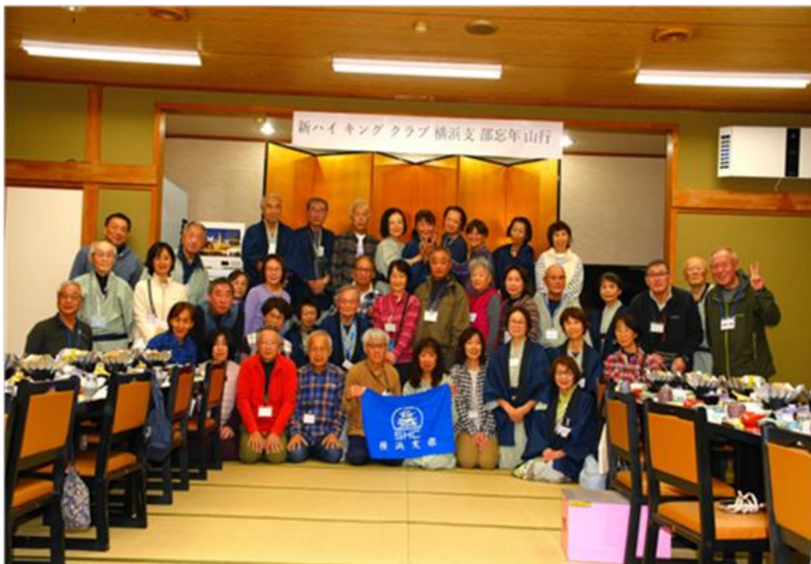
「忘年山行宿泊者による集合写真」(2024.12.14 宏池荘にて)